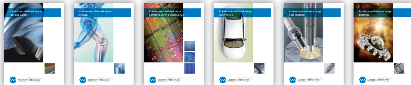
Tool & Cutter